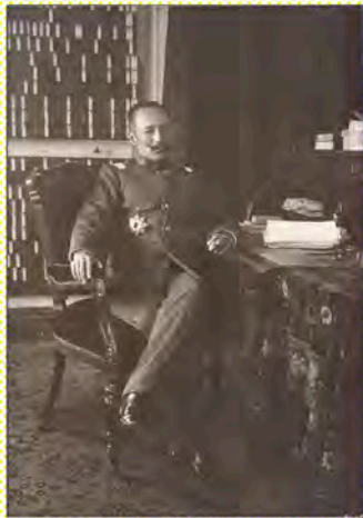
陸軍医務局長室にて 明治41年