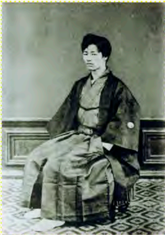
東京大学医学部卒業の頃 明治14年