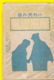
1. 鷗外自筆原稿『文づかひ』明治23年 大阪樟蔭女子大学所蔵 2. 「新著百種」1号 明治22年 3. 二葉亭四迷『浮雲』挿絵(月岡芳年画)『都の花』4巻18号 明治22年 4. 小杉天外『魔風恋風』後編 明治37年 春陽堂