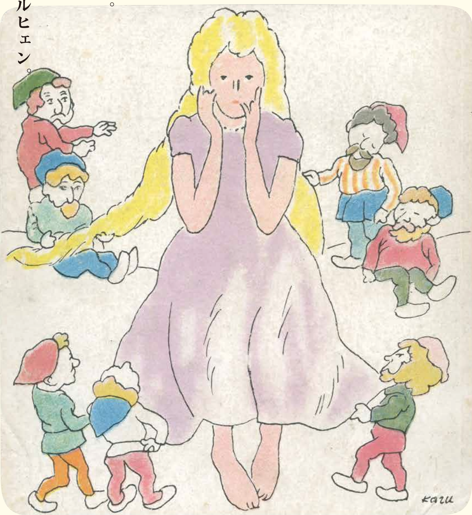
左上、右下「しあはせなハンス」より脇田 和 画